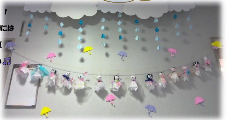
「てるてるぼうず」さん達♡