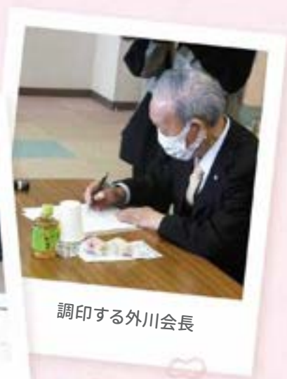
調印する外川会長