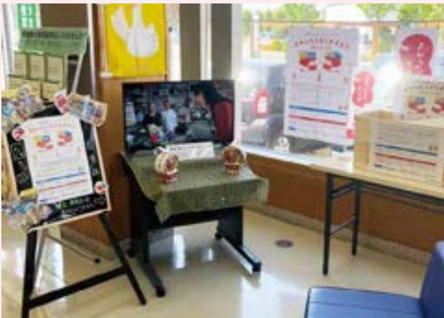
よかったらどうぞポスト (平賀郵便局)

今後も、定期的な協議の場を設け、包括連携協定を具現化できるように取り組んでまいります。そして、この協定での結びつきを活かしながら、地域福祉活動を推進していきたいと思っております!