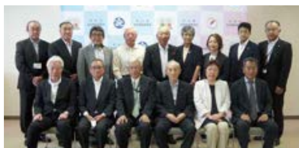
新役員のみなさん

おわりに、市民の皆様方のご健勝とご多幸をご祈念申し上げますとともに、更なるご支援、ご協力を賜りますようお願い申し上げます。