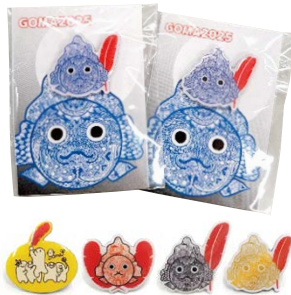
ピンバッジシリーズ