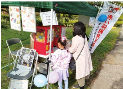
ぶらすマルシェinひらかわ紅葉めぐり(イベント型募金)