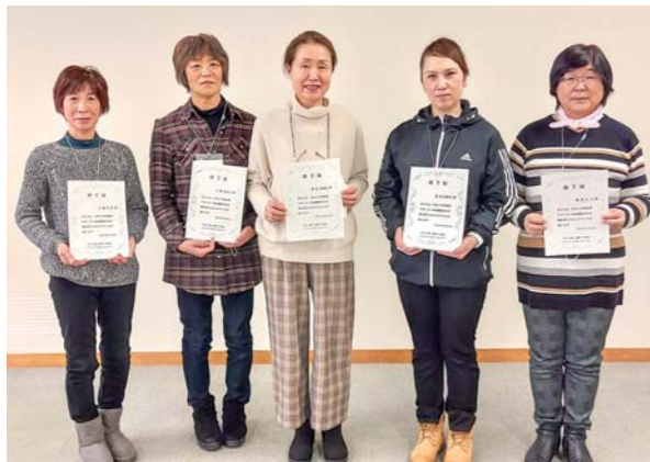
(写真：令和元・2年度保育サポーター養成講座)